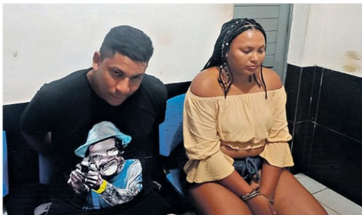
A PM foi às ruas e cumpriu mandados de prisões contra foragidos, além de flagrar traficantes com drogas

Polícia Militar efetuou várias prisões no fim de semana em Soure e Salvaterra, dando tranquilidade aos moradores