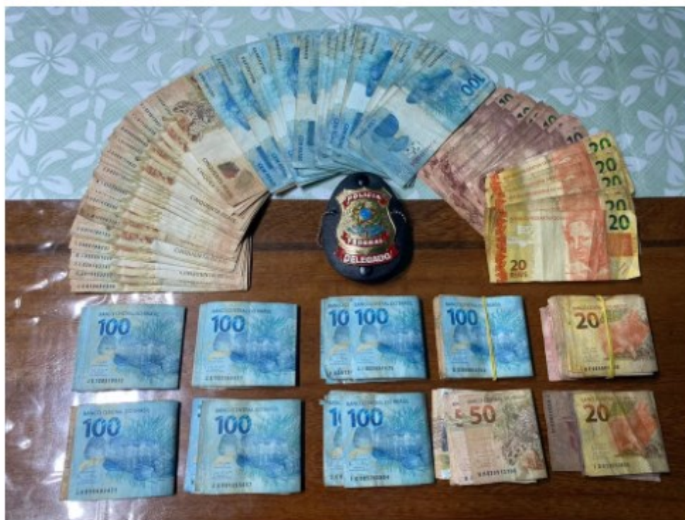
Dinheiro apreendido durante a operação em Almeirim, no Pará

Um grupo criminoso que agiu entre os anos de 2018 e 2020 em Almeirim, no oeste do Pará, é alvo da operação "Autolykos" da Polícia Federal, que tem