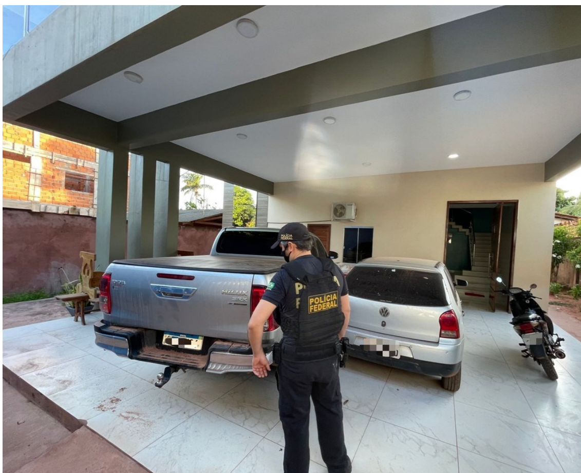
Nove mandados de busca e apreensão foram expedidos pela Justiça Federal

De acordo com as investigações, participavam do desvio funcionários públicos do município, empresários locais e agentes políticos. Durante os anos de 2018 e 2020 o grupo teria desviado, ao menos, R$ 4,1 milhões em verbas federais oriundas de convênio do aludido município com o Fundo de Manutenção e Desenvolvimento da Educação Básica e de Valorização dos Profissionais da Educação (Fundeb).