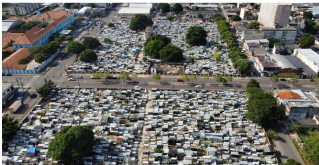
Cemitérios centrais de Santarém.

16.10.21 17h49 - Atualizado em 17.10.21 15h35