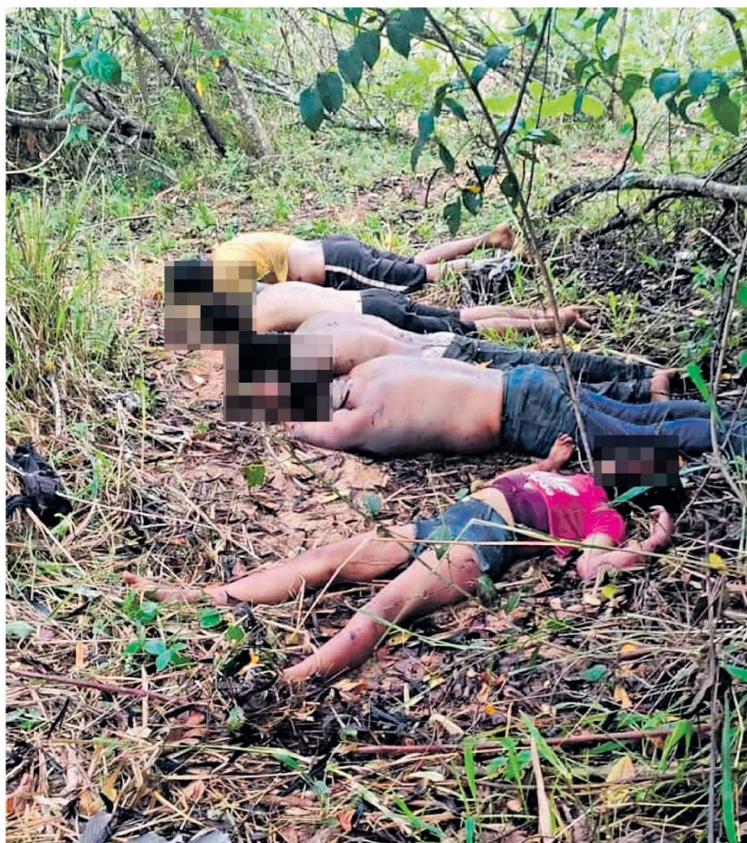
O grupo preso pela polícia é acusado de promover uma série de assassinatos em Parauapebas. Com o grupo os policiais apreenderam forte armamento.

Com o aprofundamento das investigações, a Polícia Civil concluiu que duas das cinco vítimas da "chacina de Pebas" faziam parte de uma facção criminosa denominada Comando Vermelho, sendo que um deles teria parentesco com um homem que integra o Primeiro Comando da Capital.