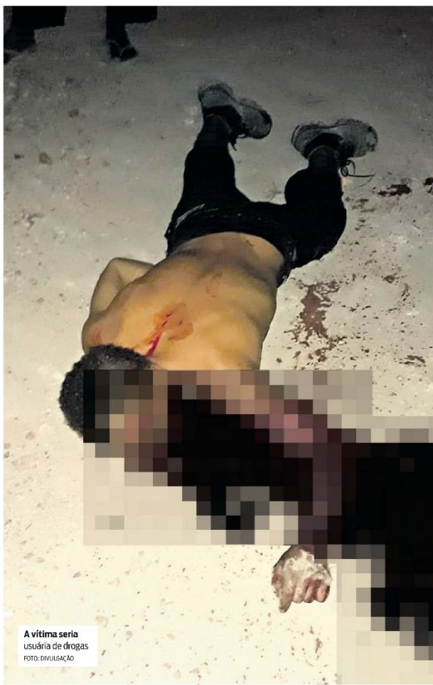
A vítima seria usuário de drogas

A Polícia Civil de Paragominas deve ouvir testemunhas e familiares do rapaz assassinado cujo corpo foi periciado e removido para o Centro de Perícias Científicas Renato Chaves.