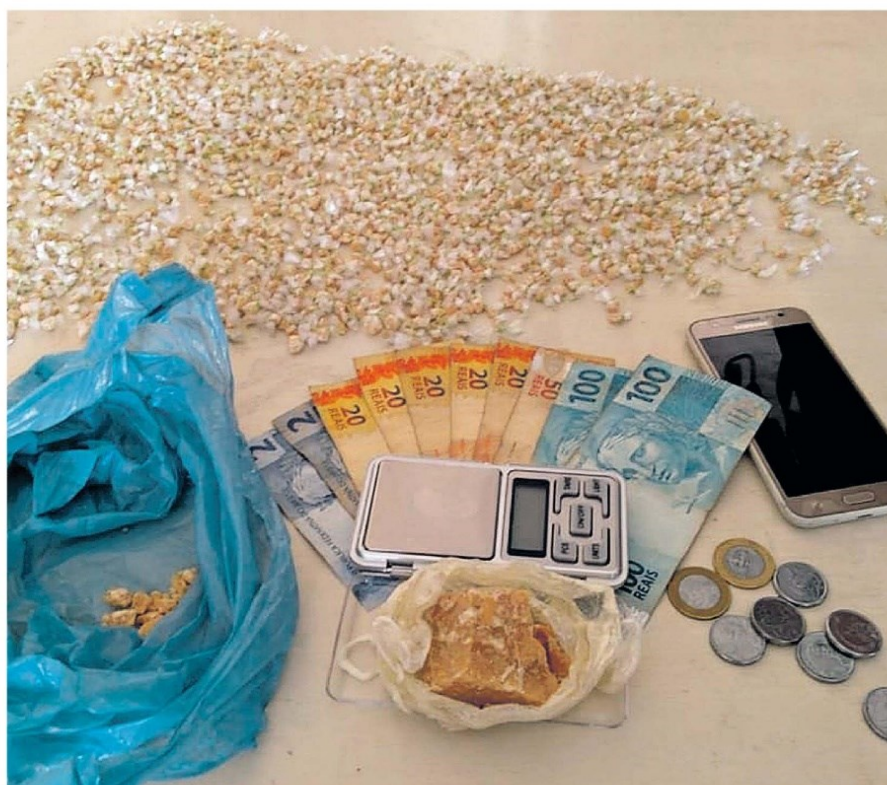
A PM tirou de circulação 1.491 pedras de óxi que estavam com um acusado de ser traficante

Também foram apreendidos os seguintes materiais: cinco munições deflagradas de espingarda calibre 28, um recipiente plástico contendo pólvora, uma balança de precisão e um aparelho celular de origem duvidosa. Ivando Santos Pontes foi apresentado na 12ª Seccional Urbana do bairro Jaderlândia, onde foi autuado em flagrante delito pelo crime de tráfico de drogas.