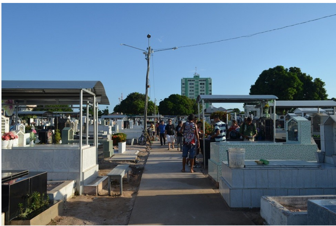
Cemitério Nossa Senhora dos Mártires, em Santarém-PA

A Procuradoria Geral do Município (PGM) de Santarém, no oeste do Pará, ingressou com recurso da decisão do juiz Claytoney Passos Ferreira, da Vara da Fazenda Pública, que proíbe a realização de sepultamentos em três cemitérios públicos da cidade. A liminar foi concedida no dia 24 de setembro em ação