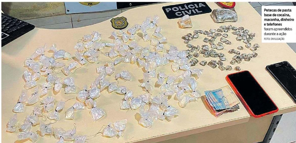
Petecas de pasta base de cocaína, maconha, dinheiro e telefones foram apreendidos durante a ação