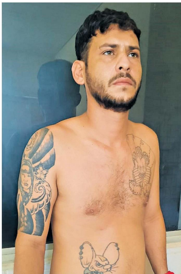
O criminoso se escondia em uma residência na Vila do Abade. Ele seria integrante da facção Comando Vermelho

Depois de ser interrogado na sede da Delegacia de Polícia Civil da cidade de Curuçá, o criminoso foi recambiado ao presídio para ficar no regime fechado novamente.