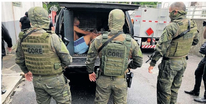
Uma parte da associação criminosa já havia sido presa no início deste mês, na primeira fase da operação. O prejuízo para as vítimas foi de cerca de R$ 500 mil

Essa foi a terceira fase da Operação Foco, deflagrada pela Divisão de Investigações e Operações Especiais (Dioe), por meio dos agentes da Delegacia de Estelionato e Outras Fraudes (Deof), da PCPA, que continuavam nas buscas pelos líderes do grupo criminoso, obtendo dados com a Polícia Rodoviária Federal e trabalhando em conjunto com a Polícia Civil do Ceará. Na ação conjunta, descobriu-se que um dos alvos estava em uma pousada, no litoral cearense. Ele foi capturado e já possuía uma prisão preventiva, decretada pela Vara de Inquéritos de Belém.