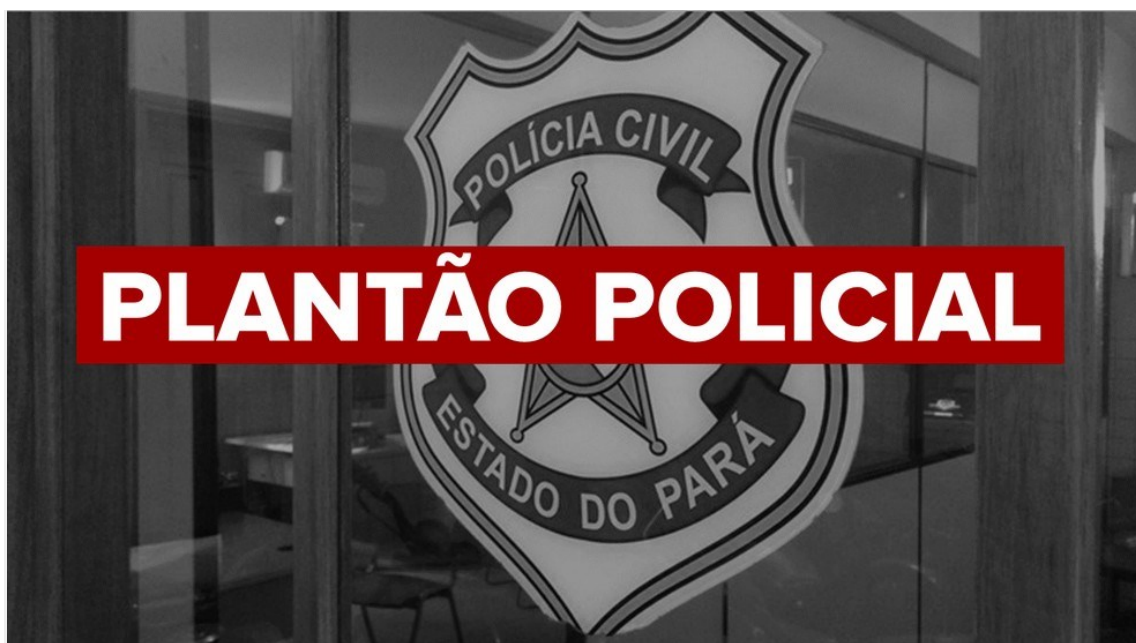
Caso foi registrado no domingo (12)

13/09/2021 09h57 Atualizado há 40 minutos