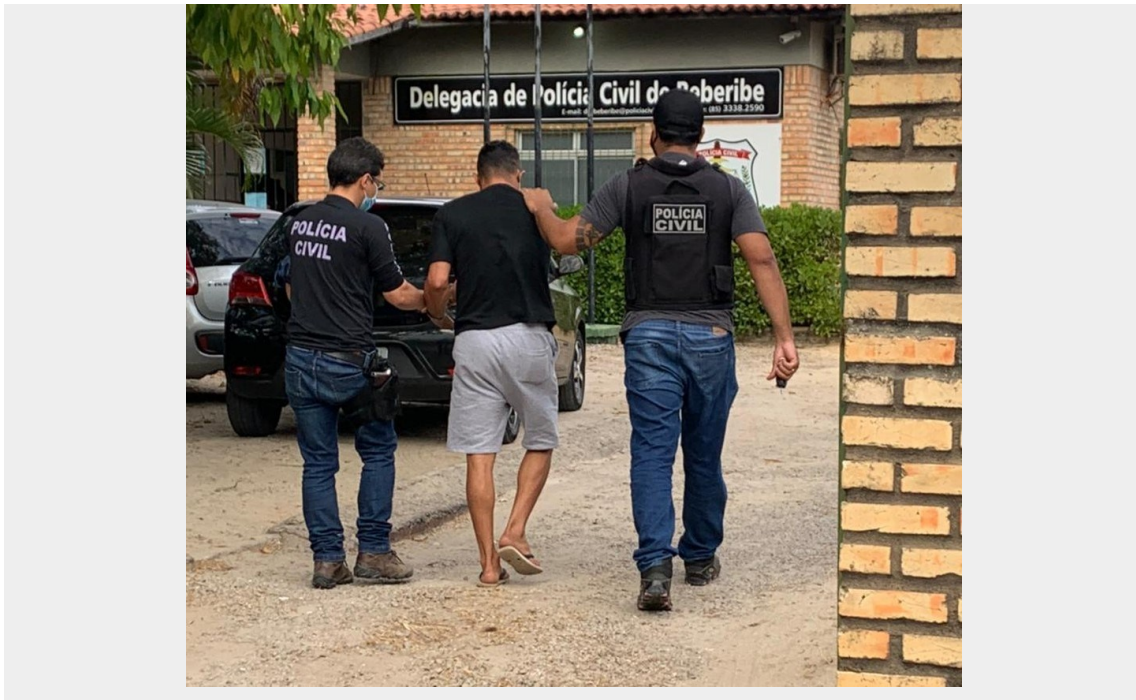
Grupo é preso em Beberibe por abrir falsos correspondentes no Ceará