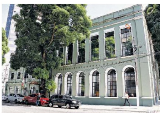
Ação da PGE pede retirada imediata da propaganda das redes

“A publicidade utiliza um discurso de que a alta dos combustíveis se dá em de-