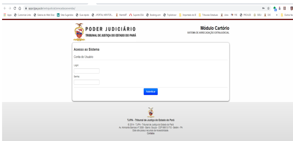
FIGURA 2 - TELA DE AUTENTICAÇÃO DA FERRAMENTA DE VENDA DE SELOS

Ao abrir a ferramenta, o cartório fará uso de seu usuário e senha que já utiliza normalmente para a aquisição de selos, conforme pode ser visualizado na figura 2: