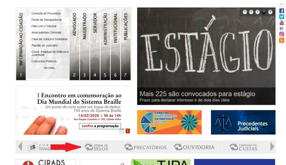
FIGURA 1 - PORTAL DO TJPA COM DESTAQUE A FERRAMENTA DE VENDA DE SELOS

A ferramenta de cadastro de cartórios já está disponível no ambiente de vendas de selo no site do TJPA conforme pode ser visualizado no destaque da figura 1: