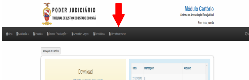
FIGURA 3 - INDICAÇÃO DO RECADASTRAMENTO COMO FUNCIONALIDADE.

No menu de opções de funcionalidades do aplicativo, irá aparecer a opção de Recadastramento, conforme pode ser visualizado na figura 3.